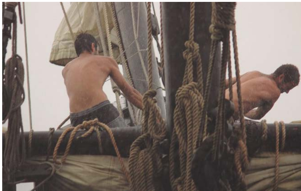
Tripulantes maniobrando las velas bajo temporal.