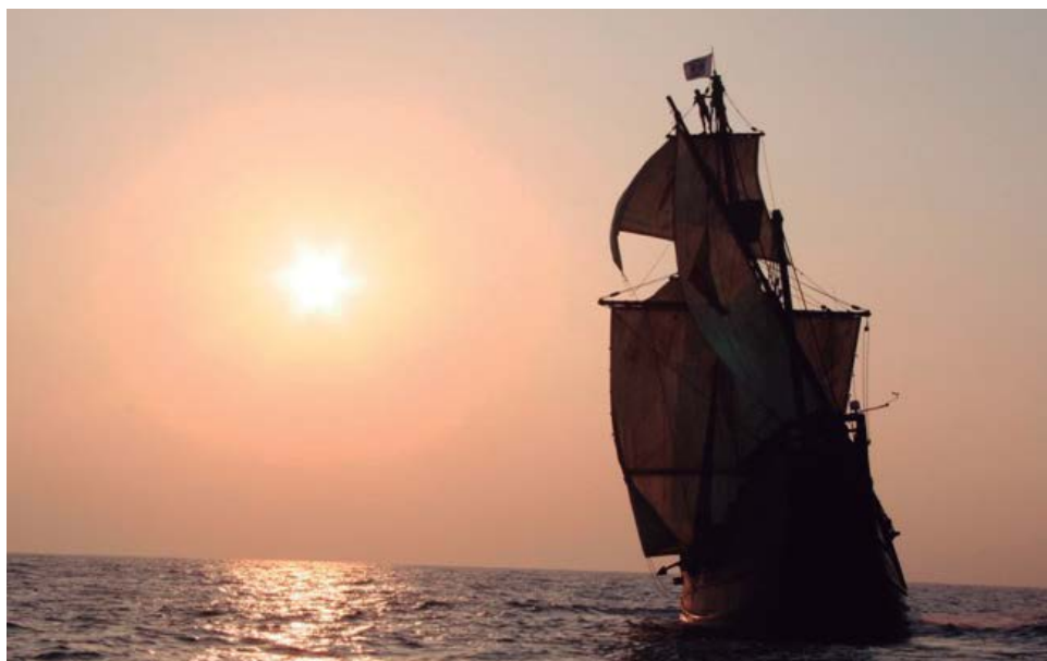
Réplica de la Nao Victoria. Diseño y construcción de Ignacio Fernández Vial.