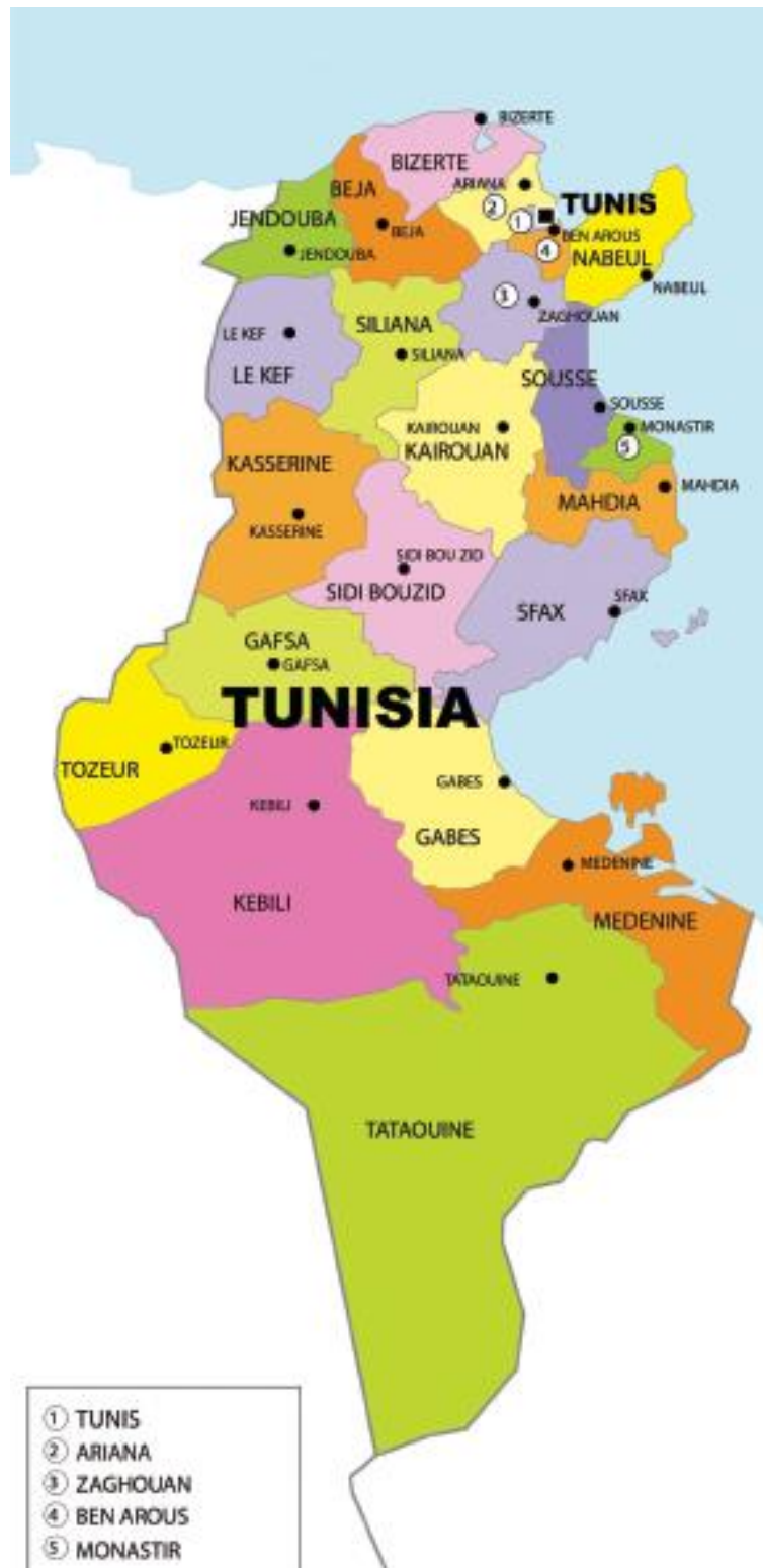
Figura A. I. Gobernaciones de Túnez